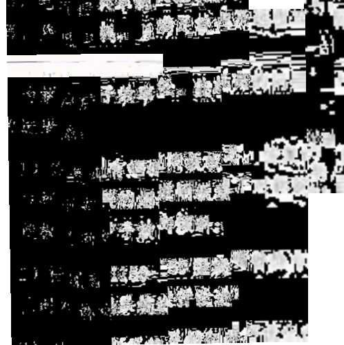
图 1-1-1 某厂工业废水处理系统